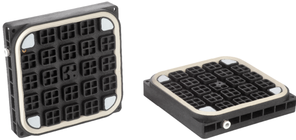
Вакуумная плита Multi-Clamp VC-M-SP / VC-M-SPV