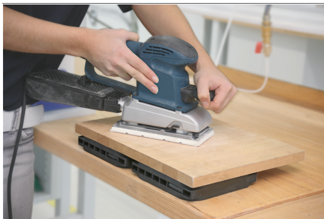
Присоска Multi-Clamp VC-M-SP для ручной обработки деревянных заготовок